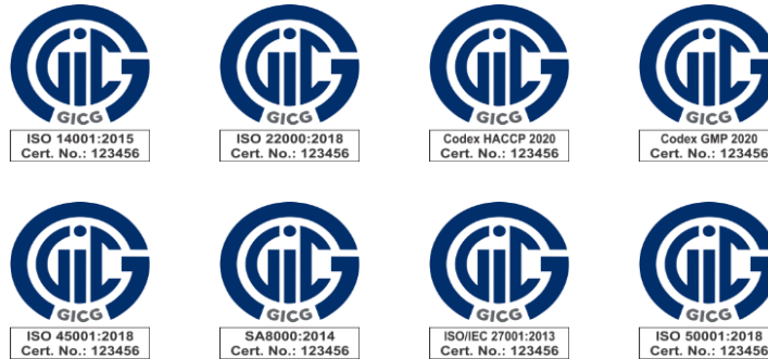
Hình 3. Chứng nhận không dùng logo công nhận